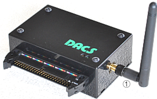
子機ケース入り DACS-9600C外観

(注) アンテナを取付けるケース側の コネクタには、上下左右に強い力を 加えないようにしてください。 アンテナに強い力を加えると、 内部の基板が破損することがあります。